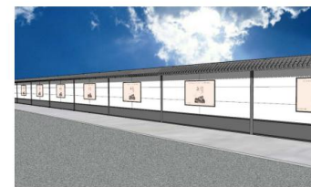
传统风格钢结构装配式围挡示意图