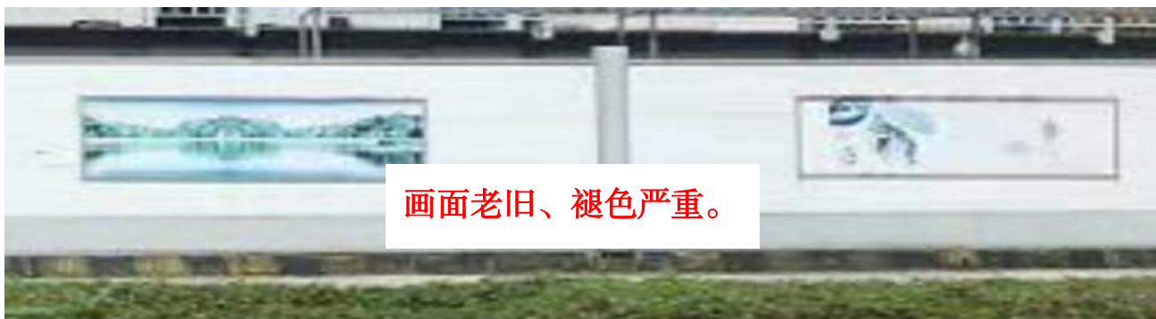
画面老旧、褪色严重。