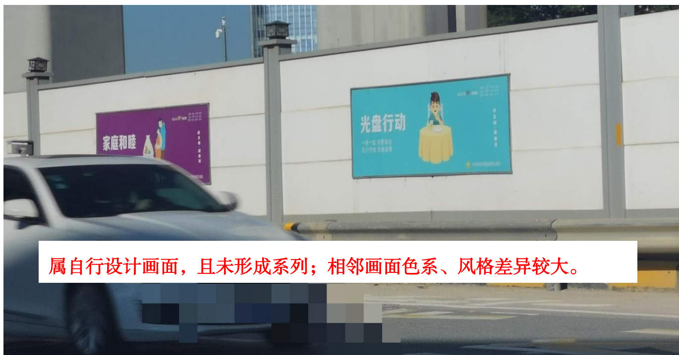
属自行设计画面，且未形成系列；相邻画面色系、风格差异较大。