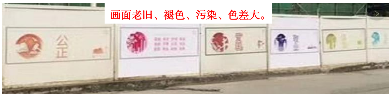
画面老旧、褪色、污染、色差大。