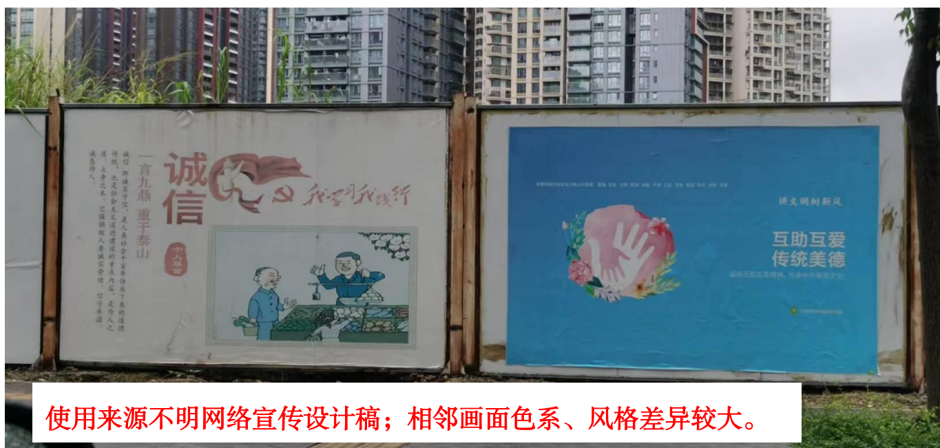
使用来源不明网络宣传设计稿；相邻画面色系、风格差异较大。