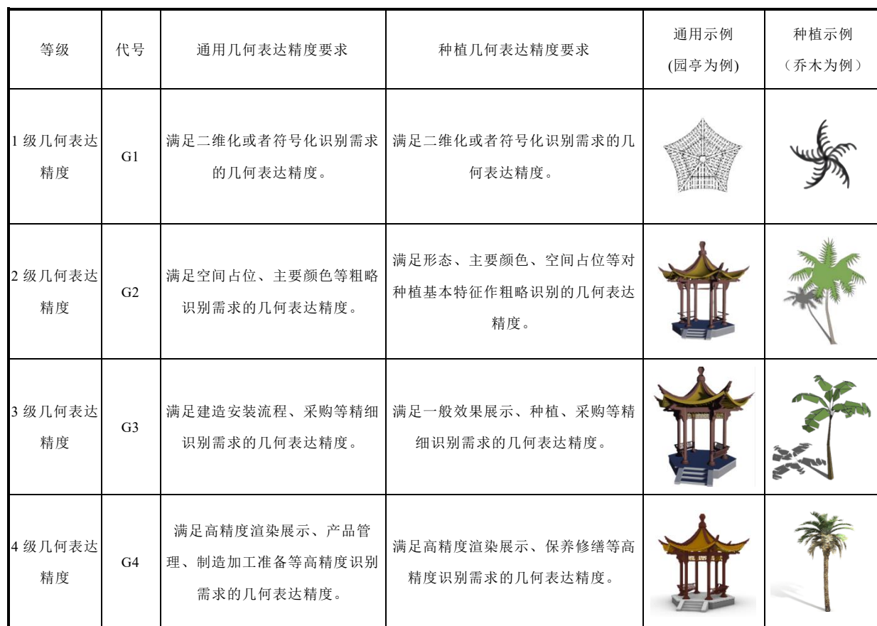
表 4.4.2 园林工程模型单元几何表达精度的等级划分

4.4.3 园林工程各分项的模型单元的几何表达精度要求应符合表 4.4.3 的规定：