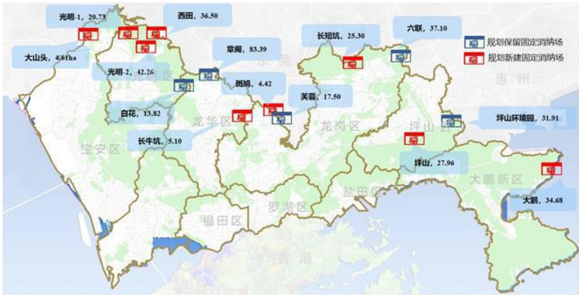
图 2.1-5 固定消纳场规划布局图 (单位: 万平方米)