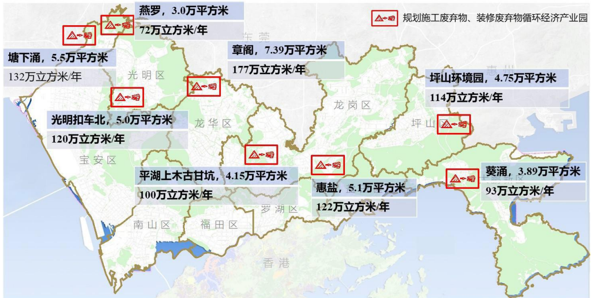
图 2.1-3 全市施工废弃物、装修废弃物循环经济产业园规划布局图