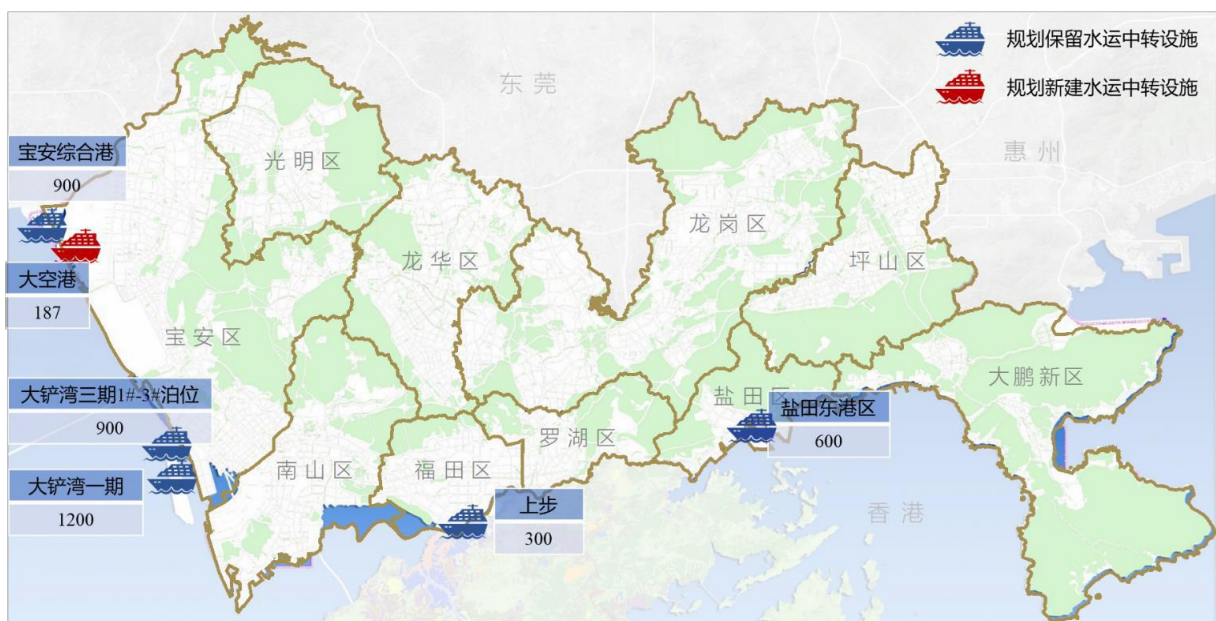
图 2.1-2 规划远期（2026-2035 年）全市建筑废弃物水运中转设施规划布局图（单位：万立方米/年）