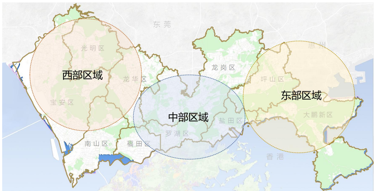
图 2.1-4 工程渣土环保烧结循环经济产业园规划布局图