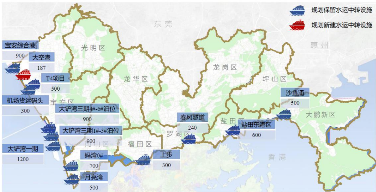
图 2.1-1 规划近期（2020-2025 年）全市建筑废弃物水运中转设施规划布局图（单位：万立方米/年）